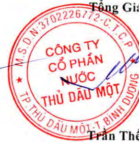
Trần Thế Hưng